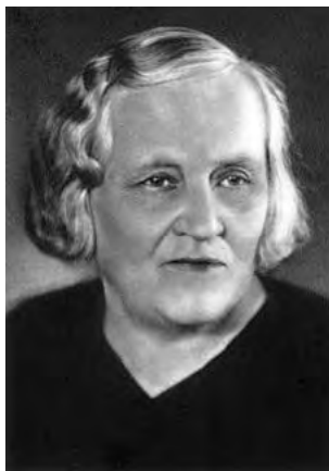
Božena Slančíková – Timrava * 2. október 1867, Polichno † 27. november 1951, Lučenec

Túžila po láske, ale nikdy nenašla toho pravého. Svoj