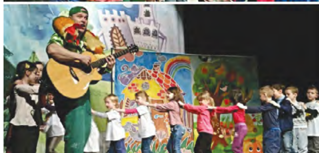
Deti z MŠ na Piaristickej ulici predviedli všetko, čo sa naučili a čo dokážu, a to aj napriek svojmu zrakovému hendikepu.