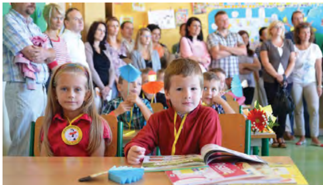
Títo prváčikovia majú za sebou už tri štvrtiny školského roka.