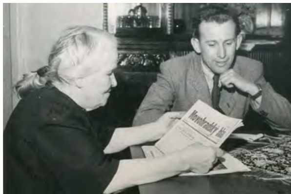
Božena Slančíková - Timrava pri čítaní novín Novohradský hlas, do ktorých prispievala.

kde aj zomrela a je aj pochovaná. Za umelecké dielo jej v roku 1947 udelili ocenenie národná umelkyňa. V súbore umelecky nenáročných básní (okolo 140) stvárnila najmä vlastné vnútorné citové krízy, sklamanie, dezilúzie, vytriezvenia. Časté boli ľúbostné motívy aj v jej prvých prózach. Pre Timravu ľúbošť bola akoby zrkadlom, v ktorom sa odrážali charakterové vlastnosti ľudí i spoločenské pomery.