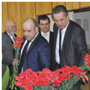
Tieto kvety venovali muži senior-kám na schôdzi v sále Spojenej školy.

Pri príležitosti MDŽ sa ženám dostalo uznania a vďaky za prácu, ktorú vykonávajú na svojich pracoviskách, ale i vo svojej druhej „zmene“ – v domácnostiach a pri výchove detí. Oslavy dňa žien sa uskutočnili v Krškanoch, Janíkovciach, oslavovali aj nitrianske seniorky.