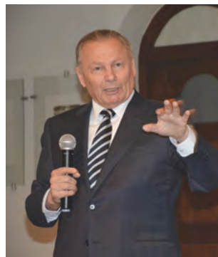
Bývalý prezident Rudolf Schuster

Po premietnutí krátko-ho filmu o jeho živote spomínal na svoje detstvo,